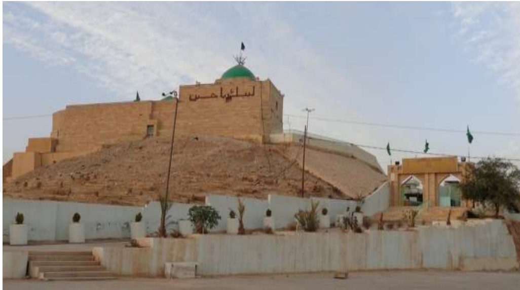
Ek 11. Ulu Cami. 406