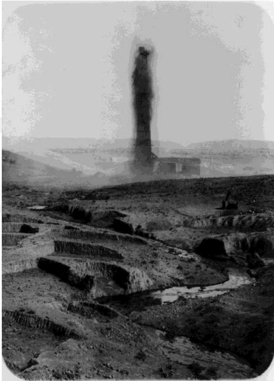
Ek 5. Baba Gurgur 1932 yılına ait bir fotoğraf. 400