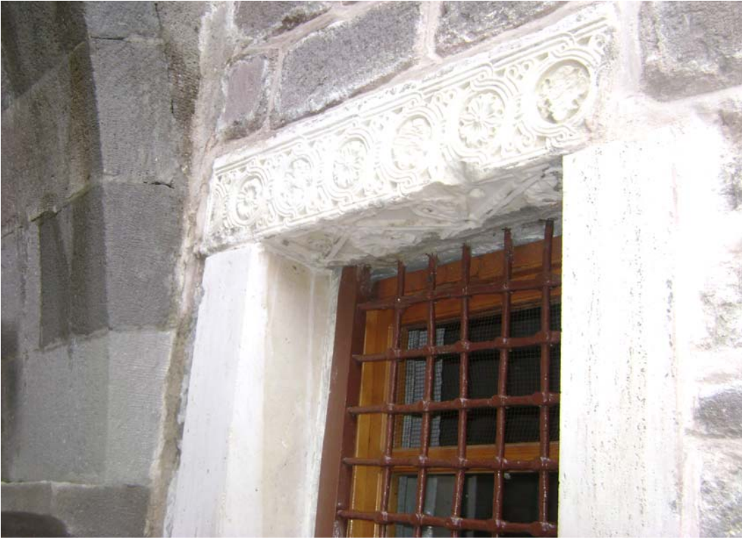
Fot. 11: Seyyid Harun Veli Camii duvarlarında Vervelit harabelerine ait parçalar