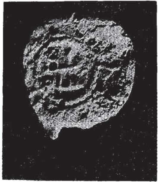
Res. 4, önyüz