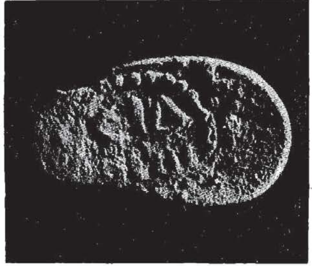
Res. 2, arkayüz