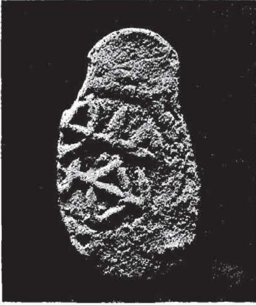
Res. 1, önyüz